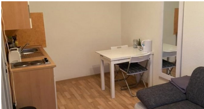
Essplatz mit offener Küche