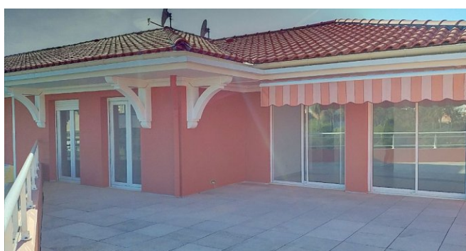
Blick aufs Haus