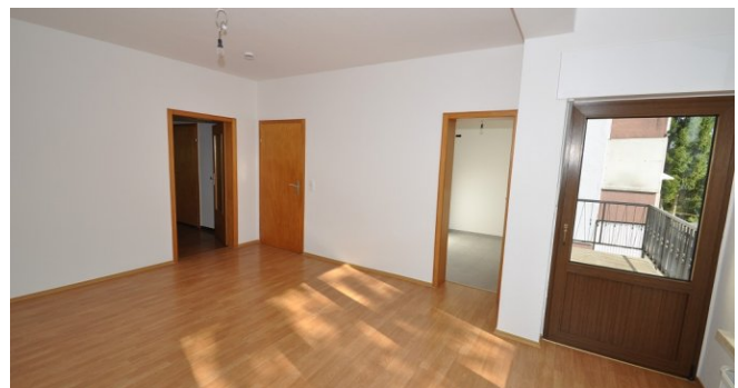
Esszimmer mit Zugang zur Küche und Balkon