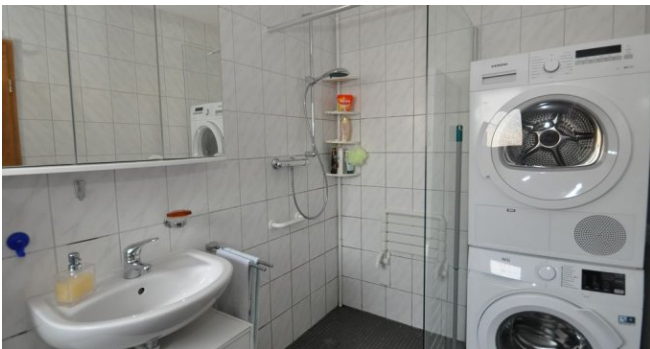
weitere Ansicht Bad