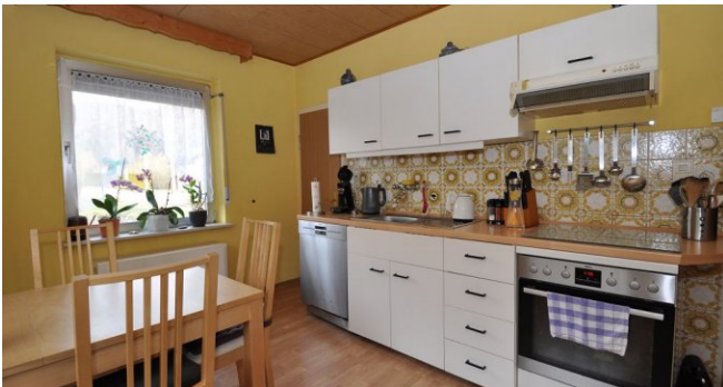
Küche mit Zugang zur Terrasse