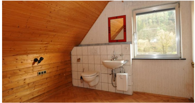
Raum / DG zum Umbau als Bad möglich