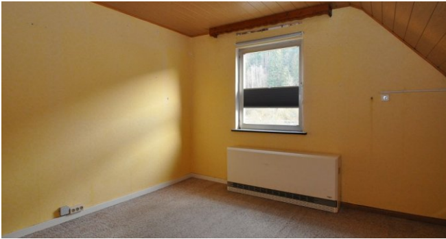
weiteres Zimmer DG