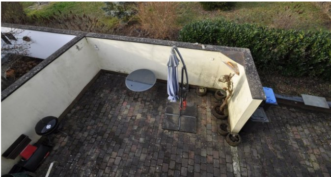
Blick auf die Terrasse