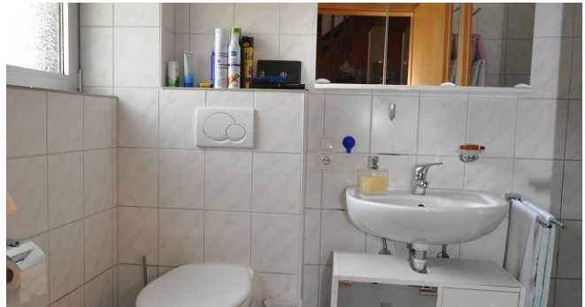
neuwertiges Bad mit begehbare Dusche