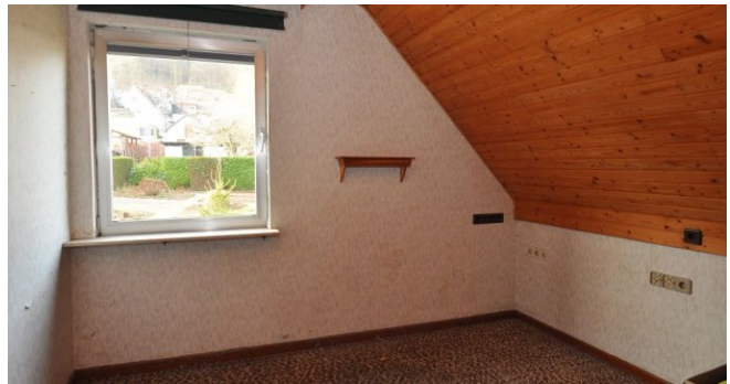
Zimmer im DG