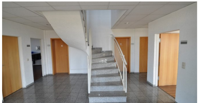
Eingang / Empfang