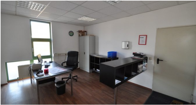
Büro 1 EG mit Zugang zur Lagerfläche