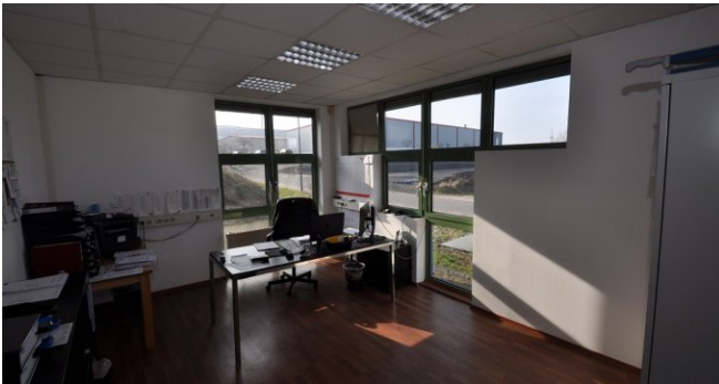
Büro 3 EG