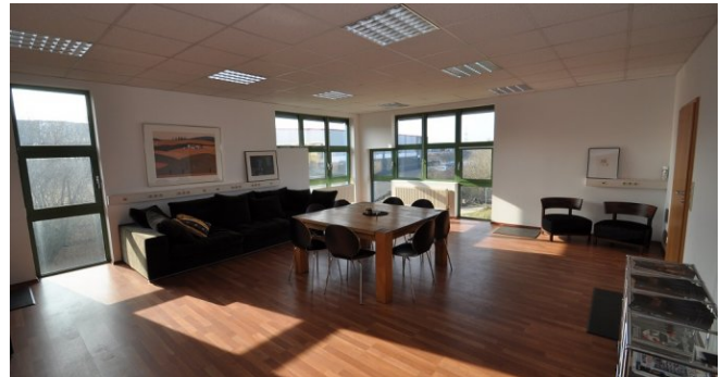
Schulungsraum oder Großraumbüro OG