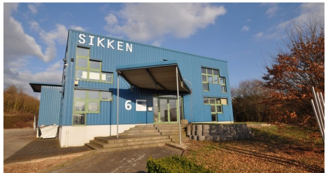
Ansicht Eingang Bürotrakt