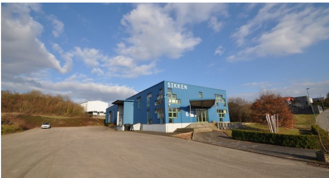
Straßenansicht mit Zufahrt

+49 651 86 349 +49 651 56145290 info@engel-immobilien-trier.de http://www.engel-immobilien-trier.de