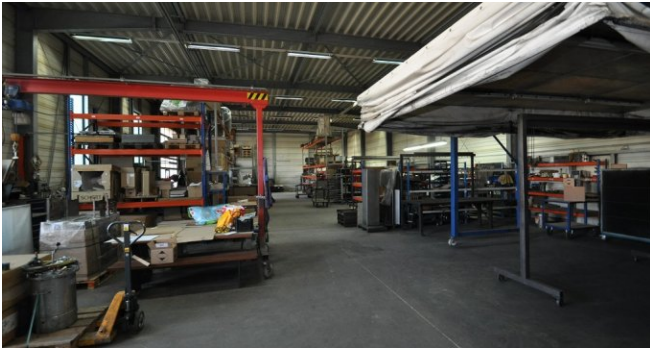
Lager- oder Produktionsfläche