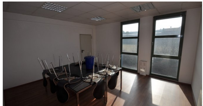
Aufenthaltsraum oder weiteres Büro OG mit Zugang z