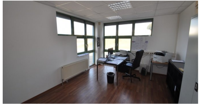
Büro 2 EG